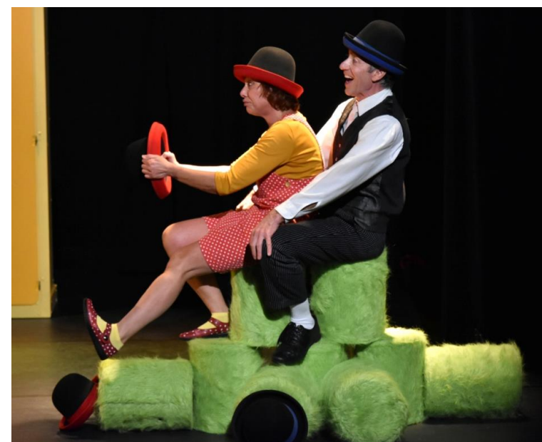
Jonglerie – Acrobatie – Chant – Comédie - Grande illusion