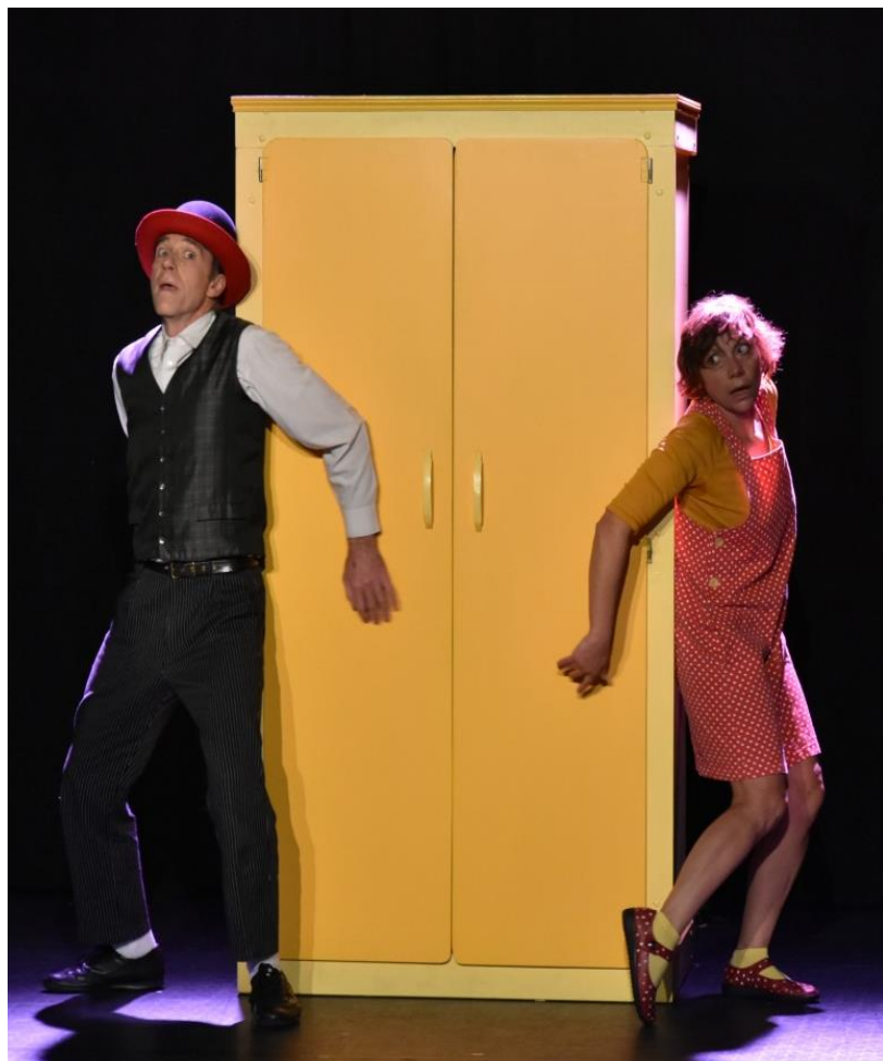
Une comédie sur le thème du partage Tout public à partir de 3 ans.